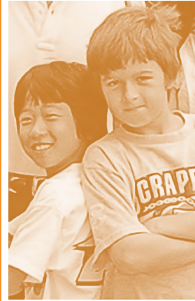
懐かしのやんちゃ坊主たち