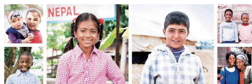
難民に、生きるための服を。UNIQLO RECYCLE

あなたが使わなくなった古着を 難民の支援に役立てることができます。 イベント期間中に回収を行います！